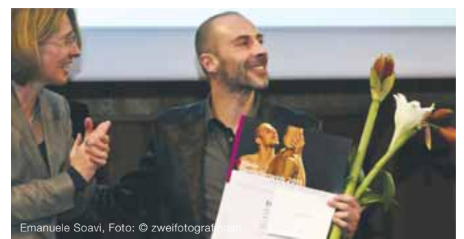
Emanuele Soavi