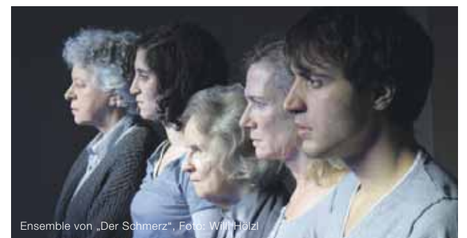
Ensemble von „Der Schmerz“, Foto: Will Holz