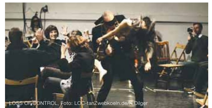
LOSS OF CONTROL