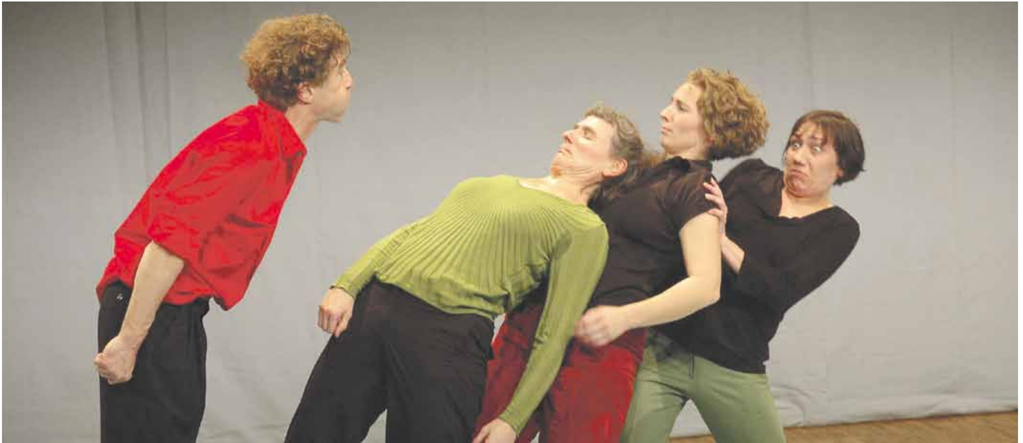
Die monteure in Streitlaune